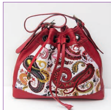
Paisley at it's best: „Odette Matchbag“, ca. 350 Euro