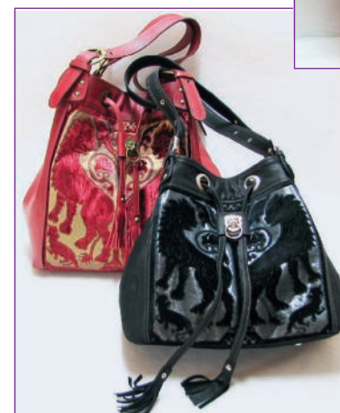
Einfach prächtig, die „Leoni Bizantini“-Taschen, ab ca. 600 Euro