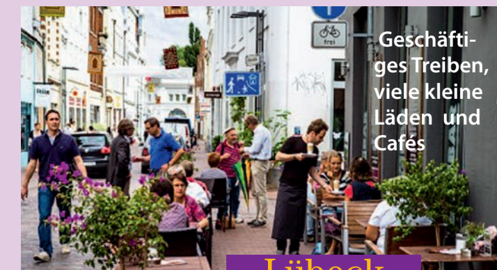
Geschäftiges Treiben, viele kleine Läden und Cafés