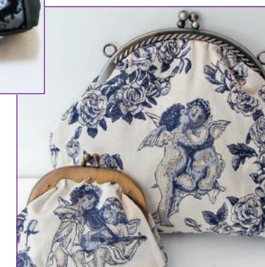
Himmlische Geldbörsen ab ca. 12 Euro